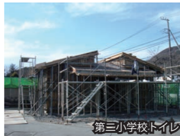
第三小学校トイレ