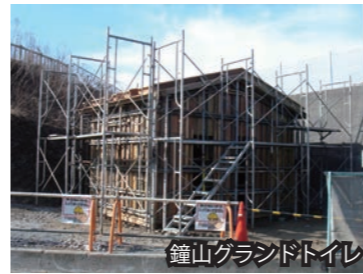
鐘山グラウンドトイレ